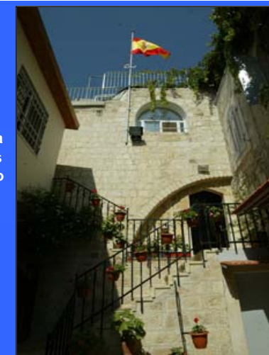
Alfabetización y convivencia solidaria de niñas palestinas desfavorecidas en el Colegio Español de Jerusalén