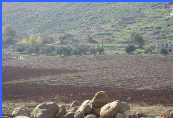
Apoyo a la mejora de la capacidad productiva del sector agropecuario del Sur del Líbano