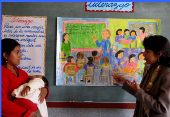
Mejora de la capacitación técnica de mujeres de escasos recursos de Cañete para la actividad económica sostenible Perú