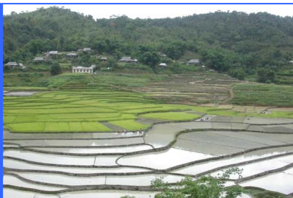
Planificación y desarrollo del ecoturismo en la reserva natural de Ngoc Hoa Bihn, proporcionando pequeñas infraestructuras, formación y materiales Vietnam