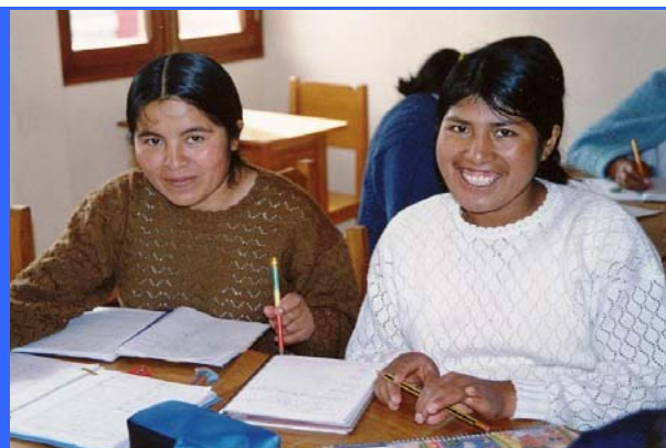
Mejora de las condiciones económicas de mujeres en desventaja de la Paz y El Alto a través de la capacitación profesional Bolivia