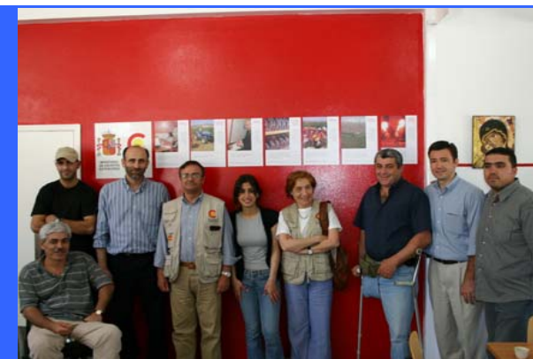
Mejorar la atención a personas discapacitadas a través del desarrollo de infraestructuras, servicios comunitarios y programas de formación en Líbano, Jordania, Siria y Egipto