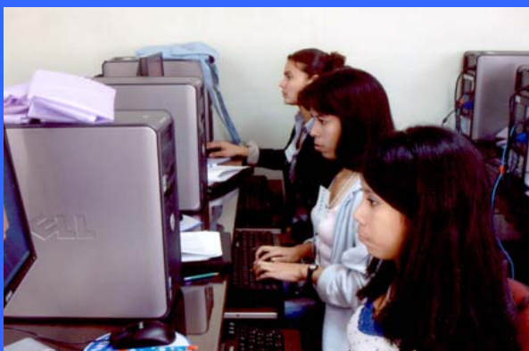
Mejora de las posibilidades de inserción laboral de mujeres de escasos recursos en Tegucigalpa Honduras