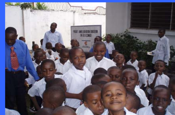
Convenio dirigido a la mejora de la educación en la República Democrática de Congo, mediante proyectos de desarrollo centrados en educación primaria, alfabetización de adultos y formación profesional, con especial atención a mujeres y niñas