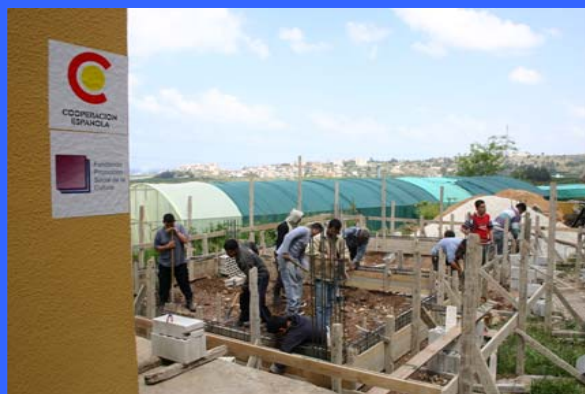
Mejora de la calidad de la educación primaria y secundaria, formación profesional y alfabetización de adultos en Territorios Palestinos, Líbano, Siria, Jordania y Egipto