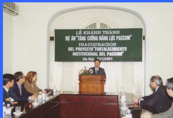
Fortalecimiento Institucional del PACCOM Vietnam