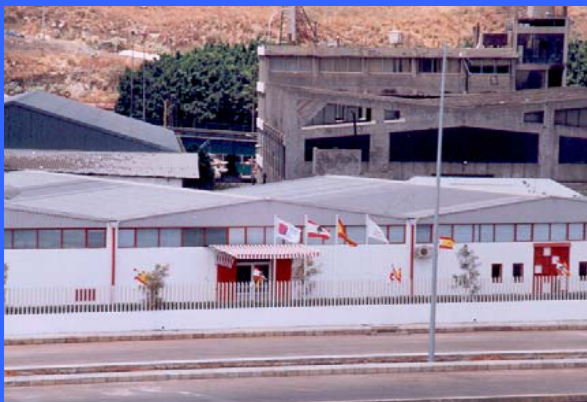
Construcción y puesta en marcha de la escuela de formación de Arcenciel para minusválidos Beirut