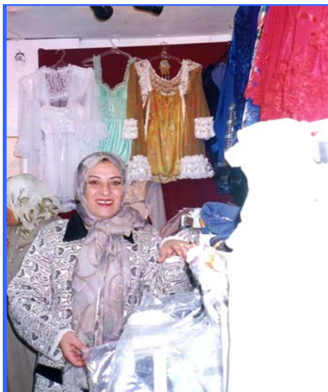
Programa de microcrédito para la mujer en Tiro Líbano