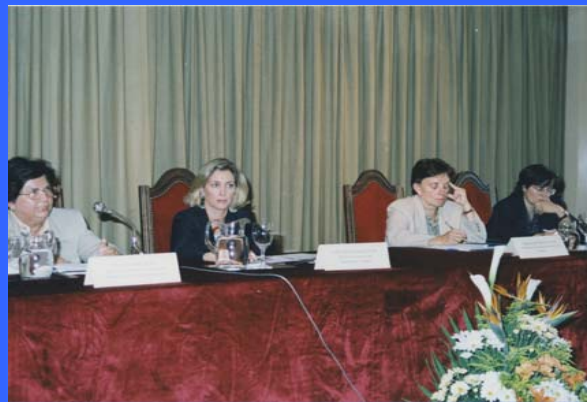
Seminario: "Mujer, Solidaridad y Derechos Humanos en el Mediterráneo" Región Mediterránea