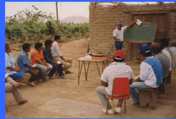
Recuperación agropecuaria de una comunidad en extrema pobreza. Pinos, Nor Yauyos Perú