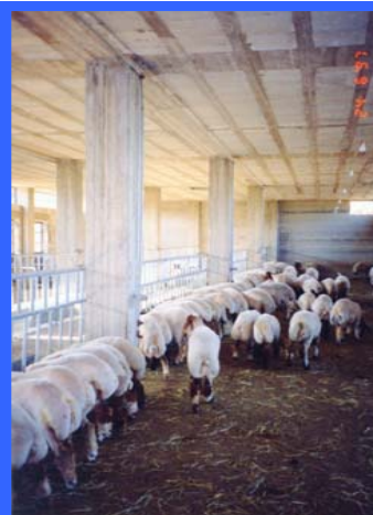
Incremento de la producción agropecuaria en el norte del Líbano. Construcción de una Granja Escuela Líbano