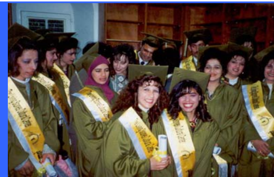
Programa de capacitación para jóvenes palestinos en el Centro de Formación de Bir Zeit Palestina