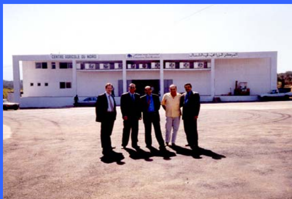
Centro Agrícola del Norte Líbano